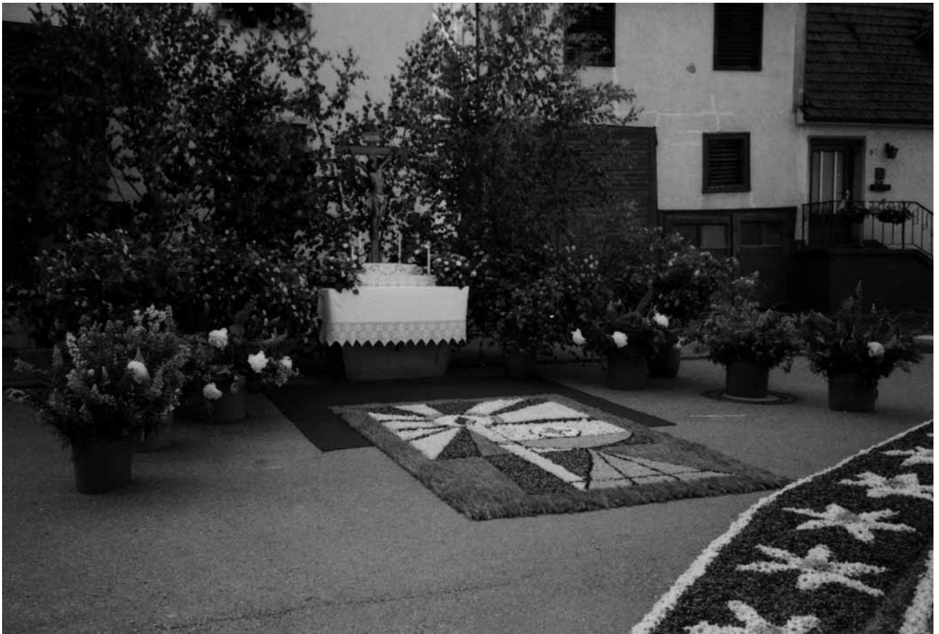
Fronleichnamsaltar in Ewattingen