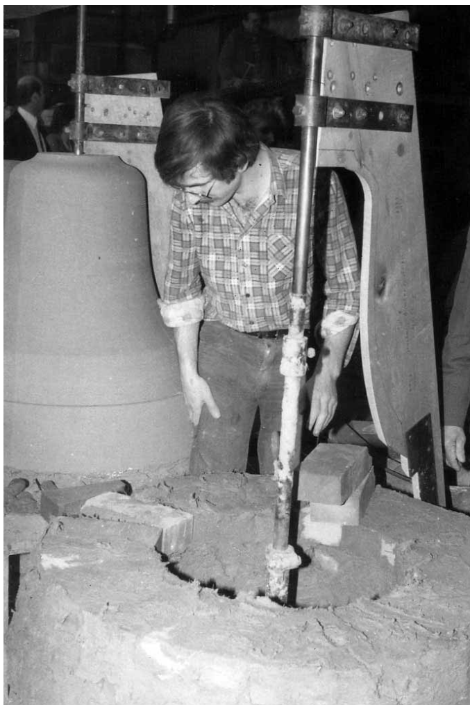
Glockenguss in Lembach im Jahr 1982