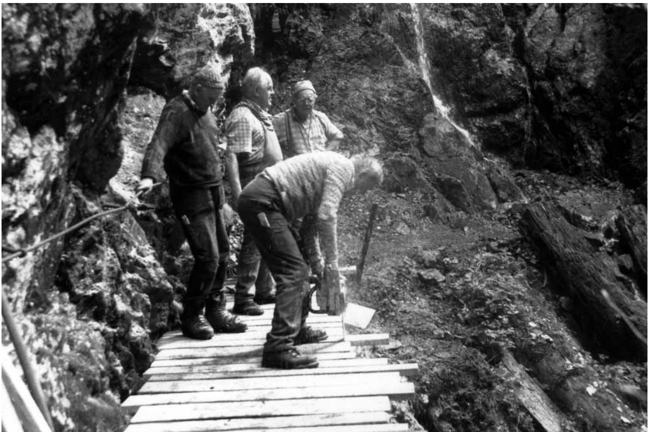
Instandhaltungsarbeiten in der Wutachschlucht durch den Schwarzwaldverein Bonndorf